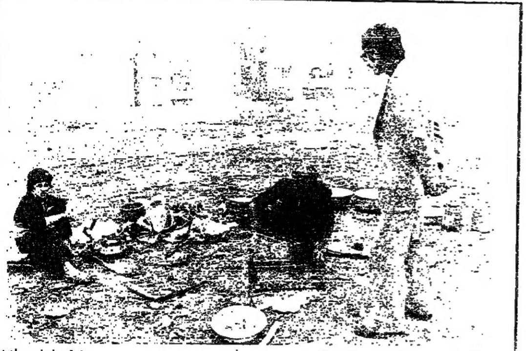
بيروت تصحو على صوت العائد